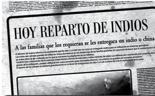
Aviso publicado en el diario La Nación en la época del genocidio de los pueblos originarios.

En 1876, Adolfo Alsina ocupó casi todo lo que hoy es la Provincia de Buenos Aires y en los años siguientes se internó en lo que hoy es La Pampa, llevando adelante una política de negociaciones y construyendo una zanja defensiva de más de 300 kilómetros de largo.