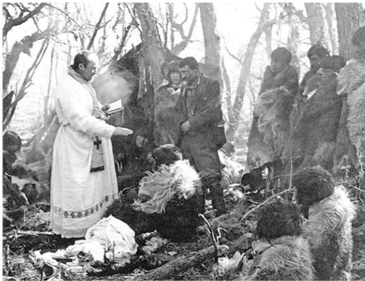
Evangelización de selk'nam.

Durante algunas décadas los ataques contra los pueblos originarios se detuvieron, entre otros motivos, porque los criollos no se ponían de acuerdo respecto de la organización del nuevo país. Hacia 1860 estos problemas estaban camino de resolverse. Desde Inglaterra y el resto de Europa había una gran demanda de lanas y productos agropecuarios. Los sectores dominantes de nuestro país necesitaban apropiarse de muchas más tierras para concretar ese enorme negocio. También les preocupaba la posibilidad de que el gobierno de Chile avanzara sobre las tierras de este lado de la cordillera. Así, los grandes estancieros prestaron dinero al gobierno para equipar al Ejército con todo lo necesario y adueñarse completamente de los territorios de la Patagonia.