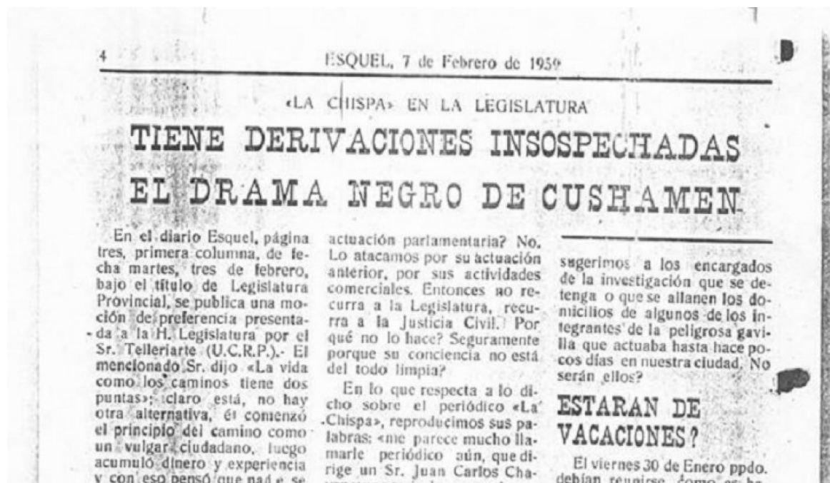
Artículo de La Chispa, de 1959