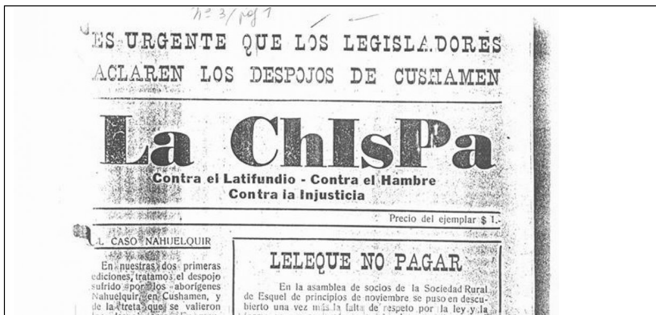
Portada del periódico La Chispa, de 1959