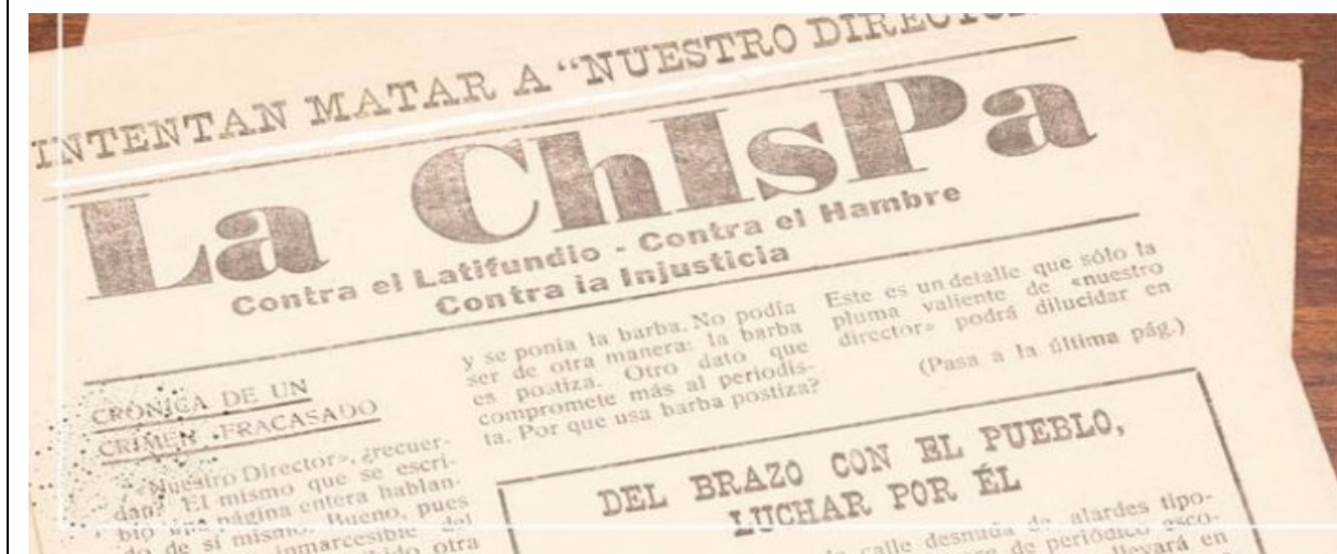
Portada de La Chispa

En ese periódico “denuncia a los latifundistas y terratenientes del lugar, describe con detalle el robo de las tierras de Cushamen por parte de comerciantes y políticos, celebra la revolución cubana, y desgrana toda su pluma contra las políticas económicas heredadas del golpe de 1955 y continuadas por lo que el periódico llama 'la gran estafa argentina' (el gobierno de Arturo Frondizi)”.